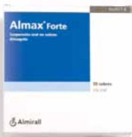
6,95 €/30 sobres

En 2012 el sistema de salud dejó de financiar Almax, uno de los más usados. Desde entonces su precio se ha incrementado un 50%.