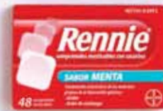
6,34 €/48 comp.