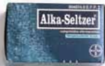
8,40 €/20 comp.