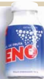
5,55 €/150 g