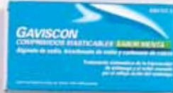
5,82 €/32 comp.