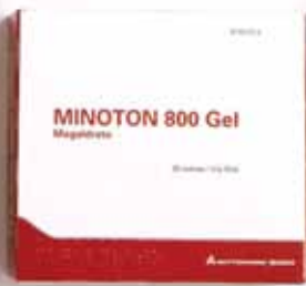
5,99 €/30 sobres