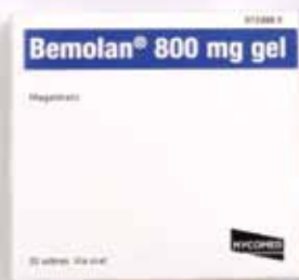
5 €/30 sobres