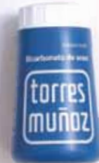
4,95 €/200 g