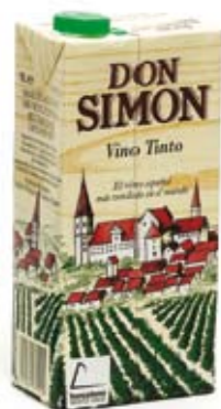
Don Simón Vino tinto cuesta 0,96 euros/litro, dos céntimos menos que en 2008.