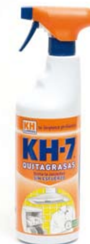
KH-7 Quitagrasa tenía en 2008 un precio medio de 2,71 euros; en 2010 ha bajado a 2,62

Alcampo conquista el índice más bajo en 17 ciudades